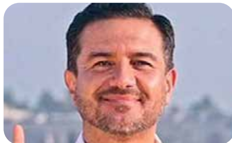
Miguel Ángel Yunes Marquez