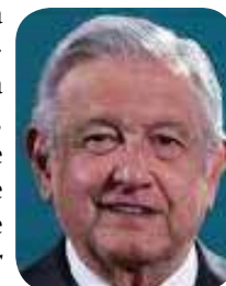
Andrés Manuel López

El presidente de la República, Andrés Manuel López Obrador, a 15 días de dejar el cargo, por fin reconoció que afección cardíaca que siempre negó, pero que tuvo que reconocer por una filtración de Los Guacamayas Leaks, que publicó Latinus.